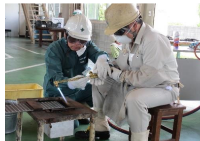
ガス溶接技能講習の実習風景

上記に書かれている講習以外でも開催できるものもございますので、まずはお問い合わせください。 特別教育、その他教育では受講料が会員価格となるものがございます。