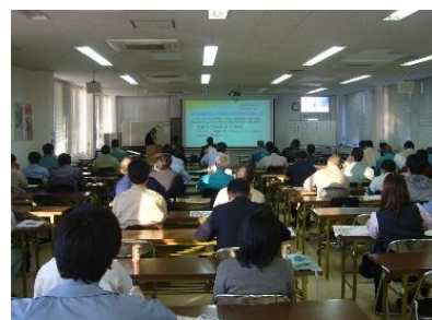
過重労働対策セミナー