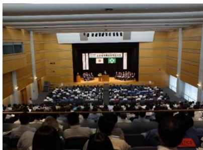
山口県産業安全衛生大会