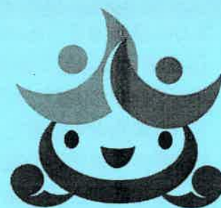
誰もが活躍できるやまぐちの企業